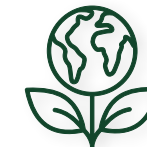
ILLUSTRAZIONE E DESCRIZIONE DELLE ATTIVITÀ GREEN ORIENTED